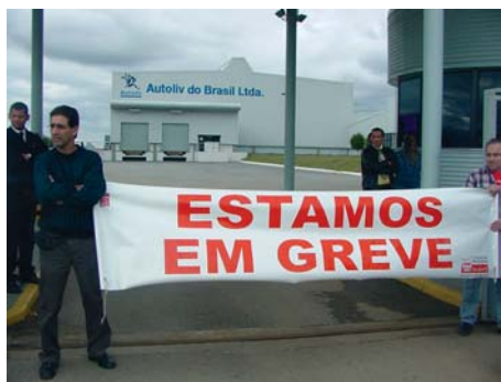
A defesa dos direitos trabalhadores é o objetivo do Sindicato