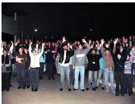
Greve foi aprovada em assembléia realizada no dia 5 de junho