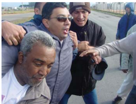
Policial agredire diretores do Sindicato durante mobilização