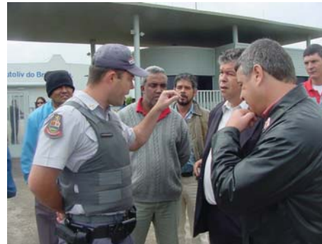
Policial agredire diretores do Sindicato durante mobilização